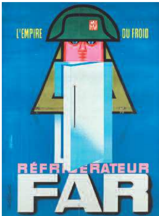
Affiche de Jacques Auriac pour les réfrigérateurs FAR.