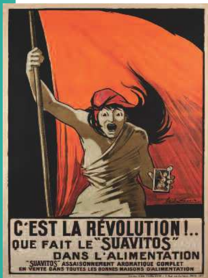
AFFICHE DE CLAUDE LESPADE, 1925.