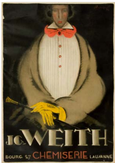
1922. Coll. J. Loupot. Lithographie