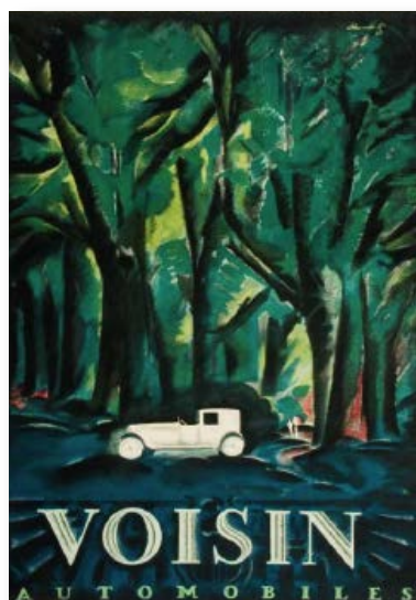
1923. Lithographie