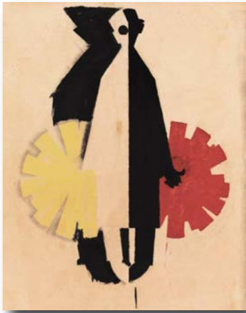
© Charles Loupot, maquette pour Nicolas, 1927. Gouache sur papier.