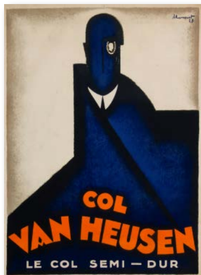
1929. Coll. J. Loupot. Lithographie

Charles Loupot collabore avec beaucoup d'annonceurs actifs dans les domaines les plus divers.