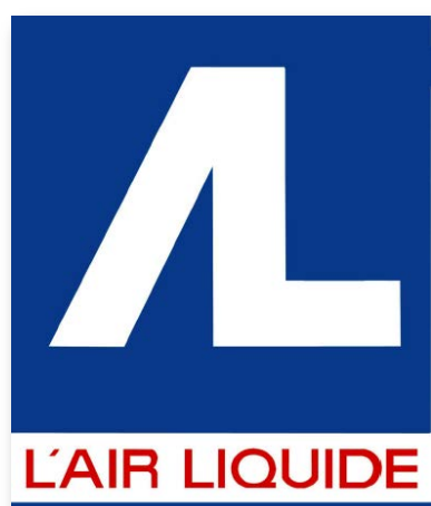
Vers 1962. Coll. Mme Loupot. Autocollant-offset

Une centaine d'œuvres, affiches et maquettes, un ensemble de pièces d'archives (correspondance, imprimés, photographies), d'objets et de sculptures publicitaires sont exposés.