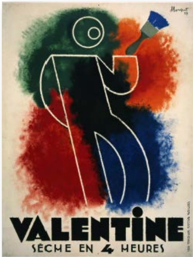
1929. Lithographie

Charles Loupot s'associe avec le grand Cassandre, les deux artistes s'estiment mutuellement mais la formule fonctionne mal. Chacun reprend sa liberté.