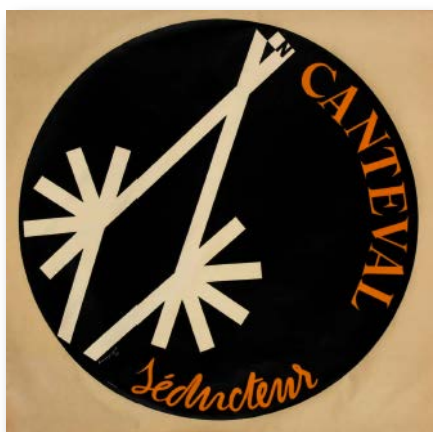
1954. Coll. J. Loupot. Lithographie