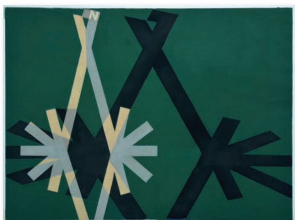
Maquette pour Nicolas, vers 1955. Coll. J. Loupot.