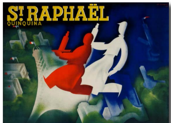
1934. Coll. J. Loupot. Lithographie