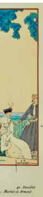
Georges Lepape. "Elle a perdu", dessin publié dans La Gazette du Bon Ton, n° 8-9, été 1915, [PER D25 Rés]