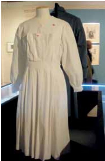
Blouse d'infirmière (avec poches pectorales). Musée de la Grande guerre de Meaux ; don Quonian (pb. C. El Guedj)