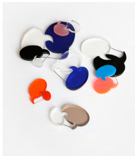
Galatée Pestre