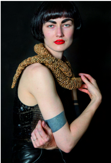
Babette Boucher