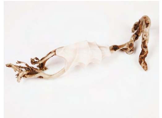
Aude Medori © Claire Pathé