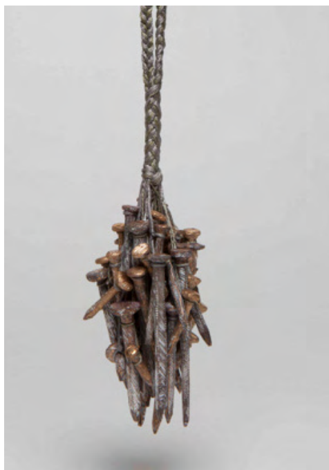
Nadine Kuffner © Mirei Takeuchi