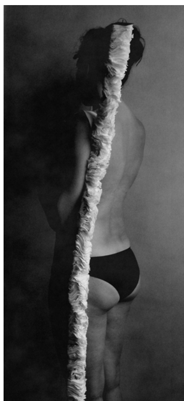
Céline Sylvestre © Céline Sylvestre