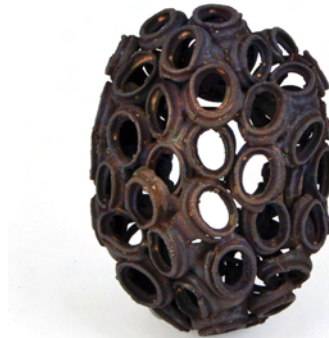
Edu Tarin