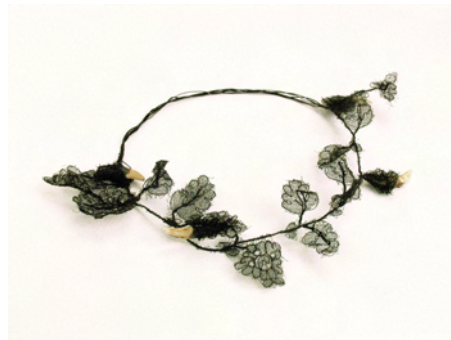
Babette Boucher © Babette Boucher