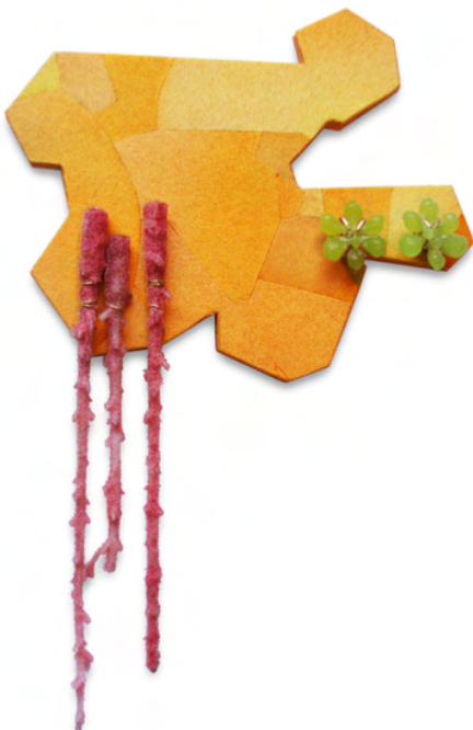
Christiane Köhne © Christiane Köhne